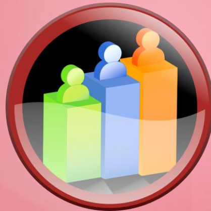
Ações de Marketing