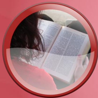
Treinamento do Vendedor